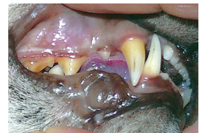
Les dents et les gencives en mauvaise santé chez un chat