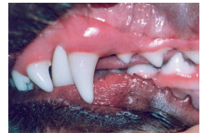
Les dents et les gencives en bonne santé chez un chien