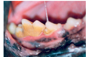
Les dents et les gencives en mauvaise santé chez un chien

85 % des chiens et 70 % des chats de plus de 3 ans montrent des signes de maladies des gencives, la cause principale de la perte des dents.