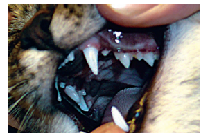
Les dents et les gencives en bonne santé chez un chat